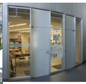
教育開発支援機構事務課